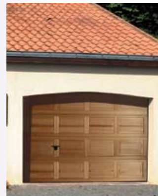
Modèle à cassettes bois ISO 45