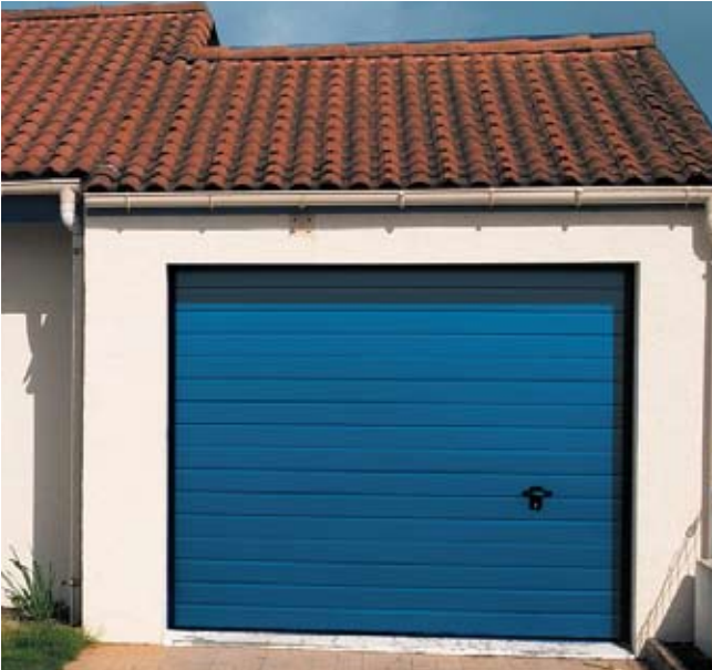
Porte sectionnelle ISO45 nervurée bleue