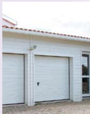
Modèle Maeva nervuré double blanc