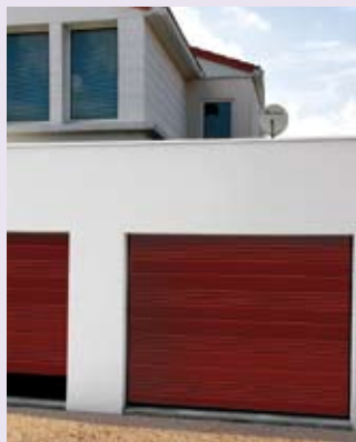
Modèle Maeva nervuré pourpre