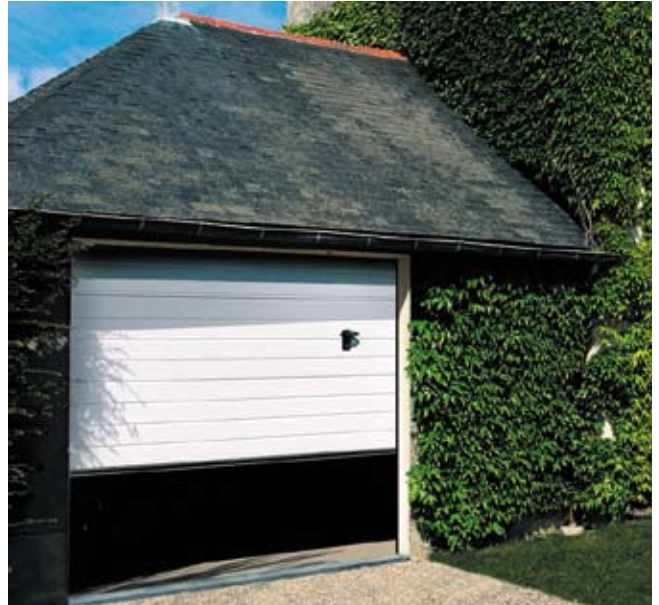
Porte sectionnelle ISO 45 nervurée