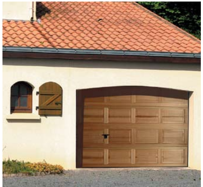
Porte sectionnelle à cassettes ISO 45