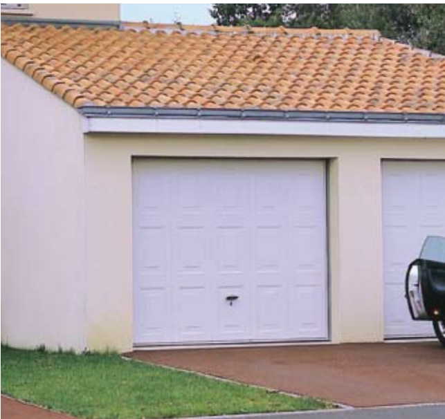
Porte basculante DL sans portillon