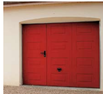
Modèle Deliso K7 rouge