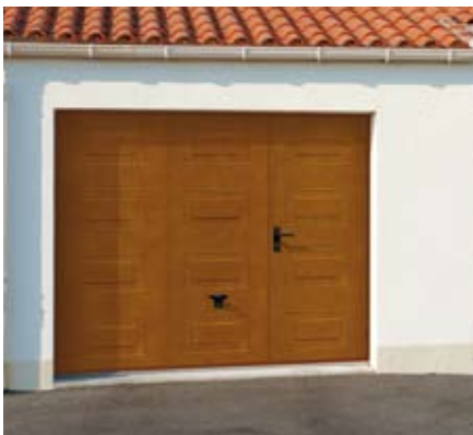
Modèle Deliso vernis chêne doré