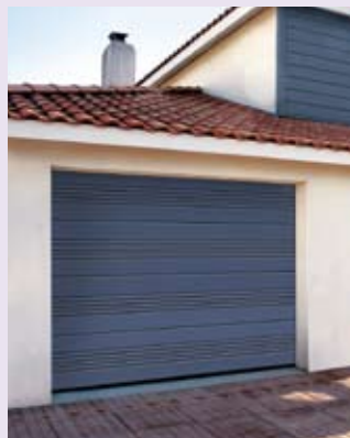
Modèle Maeva nervuré zinc