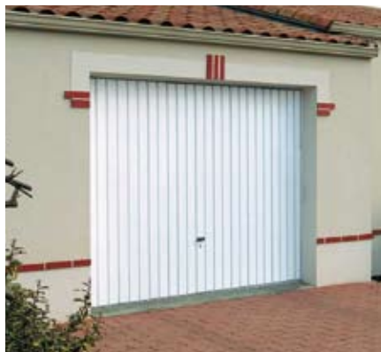
Modèle DWN nervuré blanc