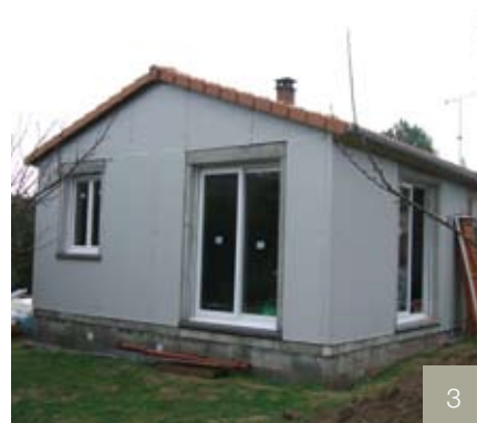
1/ Mise en place de la charpente métallique - 2/ Mise en place de panneaux isolants - 3/ Pose nouvelles menuiseries et couverture