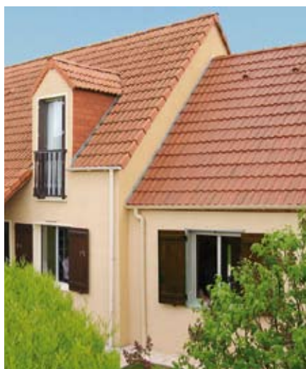
Agrandissement avec façade et toiture décalées.