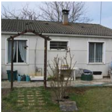
Maison avant les travaux