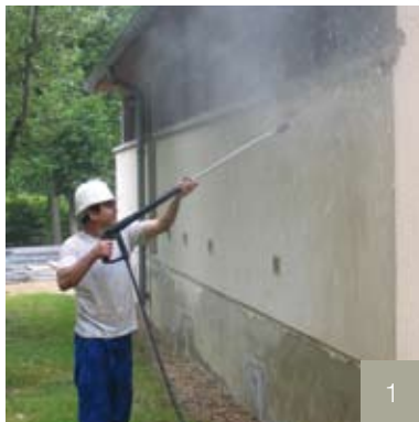
1/ Nettoyage et traitement des fissures.