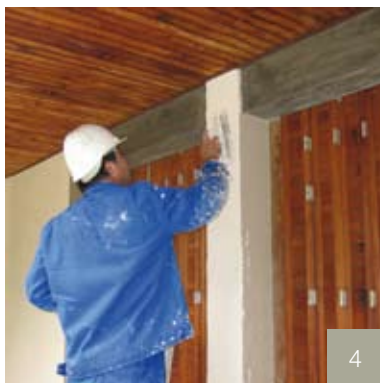
4/ Application de l'enduit de finition.