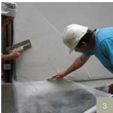
3/ Entoilage des murs.