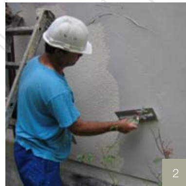
2/ Application de l'enduit de ragréage.