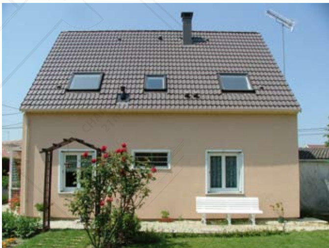
Maison après les travaux