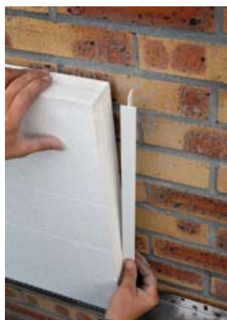
Pose des panneaux en polystyrène expansé