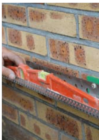
Fixation du profil de départ