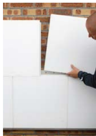
Pose des panneaux en polystyrène expansé