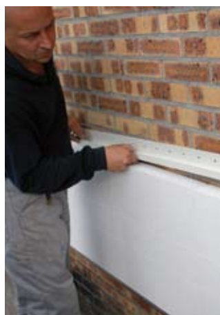
Fixation des rails sur le mur