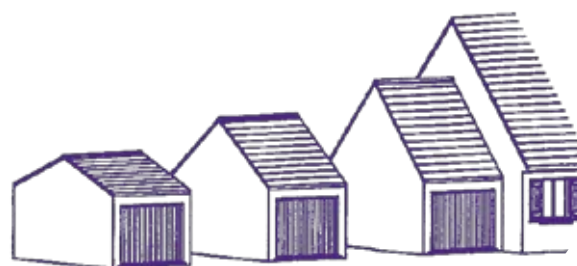
Possibilités de garages simples