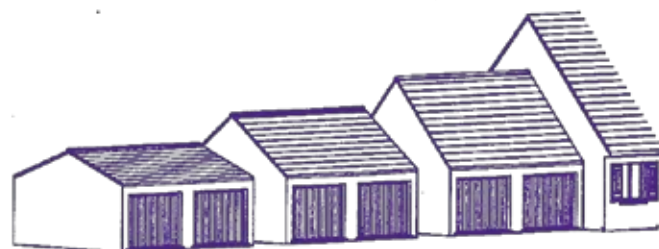
Possibilités de garages doubles