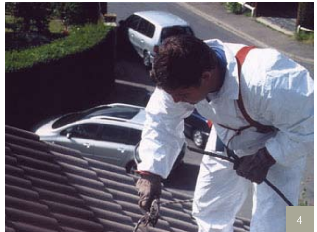
4/ Recoloration au pistolet en deux passes.