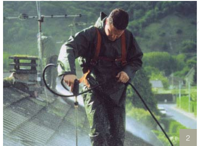
2/ Nettoyage, démoussage et décapage haute pression.