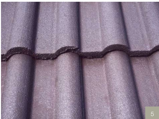
5/ Aspect des tuiles après recoloration.