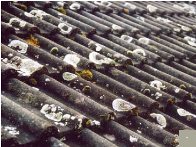
1/ Avant les travaux.