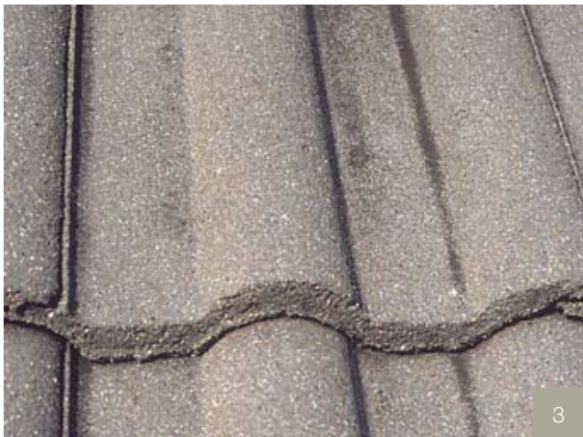
3/ Aspect des tuiles après le nettoyage.