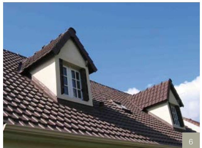
6/ Après travaux : teinte brune pour longtemps.

Photos et documents non contractuels.